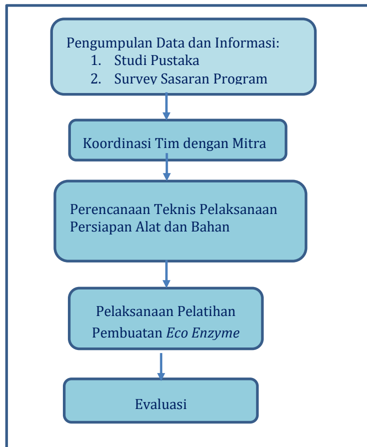
Gambar 2. Alur Kegiatan Pengabdian kepada Masyarakat.