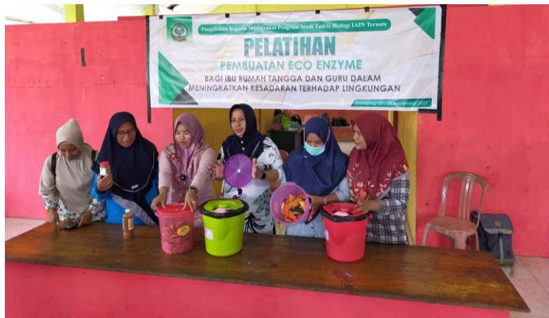
Gambar 3. Alur Kegiatan Pengabdian kepada Masyarakat

Dalam sosialisasi tersebut, tim PkM memaparkan tentang pengolahan limbah dapur dapat dilakukan dengan sangat sederhana ini oleh siapapun dan kapanpun. Hal ini tidak memerlukan biaya yang besar karena segala peralatan yang digunakan bisa dengan memanfaatkan barang-barang bekas. Berbagai manfaat didapatkan dari pembuatan Eco Enzyme , seperti sebagai pupuk organik cair, mencuci perabotan dapur, mencuci pakaian, pembersih lantai, disinfektan, handsanitizer ., Selain itu juga dapat digunakan untuk perawatan kulit wajah dan pengobatan berbagai macam penyakit. engobatan berbagai macam penyakit. Selain memberikan sosialisasi tentang pengolahan limbah dapur, tim PkM juga memberikan sosialisasi terkait pemanfaatan limbah secara umum menjadi produk yang bernilai guna dan bernilai ekonomis. Dengan adanya edukasi terkait pemanfaatan limbah diharapkan masyarakat khususnya ibu rumah tangga dapat memiliki kepedulian terhadap lingkungan.